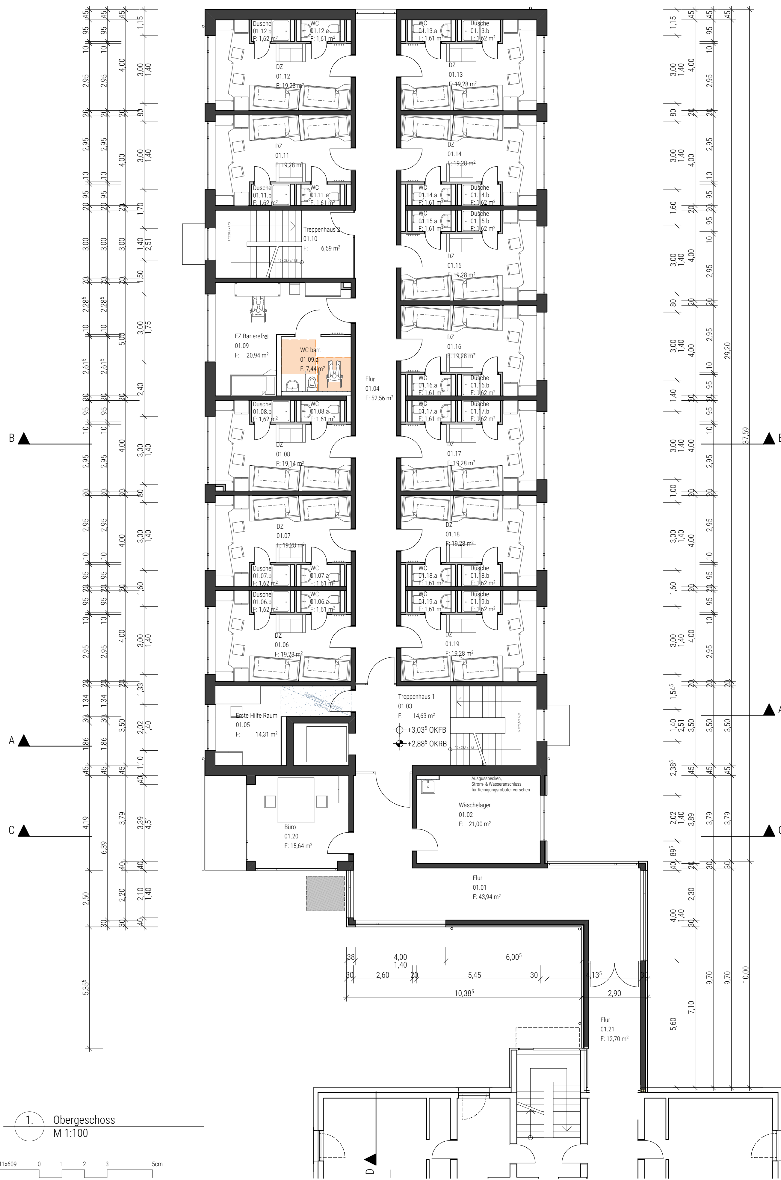
1. Obergeschoss M 1:100